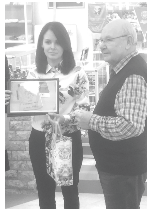
Сотрудники Территориального фонда обязательного медицинского страхования передают в Музей медицины Калужской области фотографии архивных документов, свидетельствующих о переходе региона в 1993 году в систему обязательного медицинского страхования.

За три десятилетия функционирования обязательного медицинского страхования в нашей стране удалось создать устойчивую систему оказания и оплаты медицинской помощи по ОМС, обеспечить доступность медицинской помощи гражданам в медицинских организациях как Калужской области, так и за ее пределами. Широкое внедрение средств информатизации в деятельность участников ОМС существенно ускорило обработку и обмен большими массивами информации, обеспечило возможность оперативного анализа и контроля объемов оказываемой медицинской помощи, создало условия для рационального планирования и распределения ресурсов обязательного медицинского страхования в зависимости от фактической потребности населения в медицинской помощи. За годы своего существования обязательное медицинское страхование показало свою устойчивость и способность обеспечивать доступность и качество медицинской помощи населению вне зависимости от фактического региона проживания застрахованного лица.