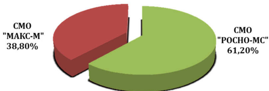
Численность застрахованных лиц в СМО

Оценка показателей деятельности страховых медицинских организаций, осуществляющих свою деятельность в сфере обязательного медицинского страхования на территории Калужской области, по защите прав и законных интересов граждан, контролю объемов, сроков, качества и условий предоставления медицинской помощи за 2014 год